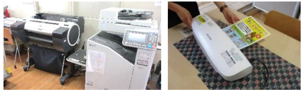
ポスター印刷機 コピー印刷機 ラミネーター

北コミュニティセンターで、ポスターの印刷、普通印刷(白黒・カラー)、ラミネート加工が有料でできます。ポスターは最大A1サイズまで、横断幕は幅60センチ、長さは任意です。いつでも、お気軽にご利用ください。