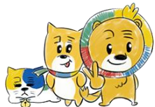
NPO法人共働のまち大野城 PRキャラクター