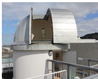
スタードームまどか