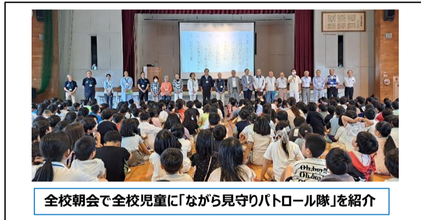
全校朝会で全校児童に「ながら見守りパトロール隊」を紹介

東地区コミュニティ運営協議会では、まちづくり活動として、地域で子ども達を守るためのパトロール隊「ながら見守りパトロール隊」を結成し、たくさんのシニアクラブの方や地域の方に参加していただいています。令和8年6月2日に、大城小学校全校朝会で「ながら見守りパトロール隊」の隊員紹介を行いました。