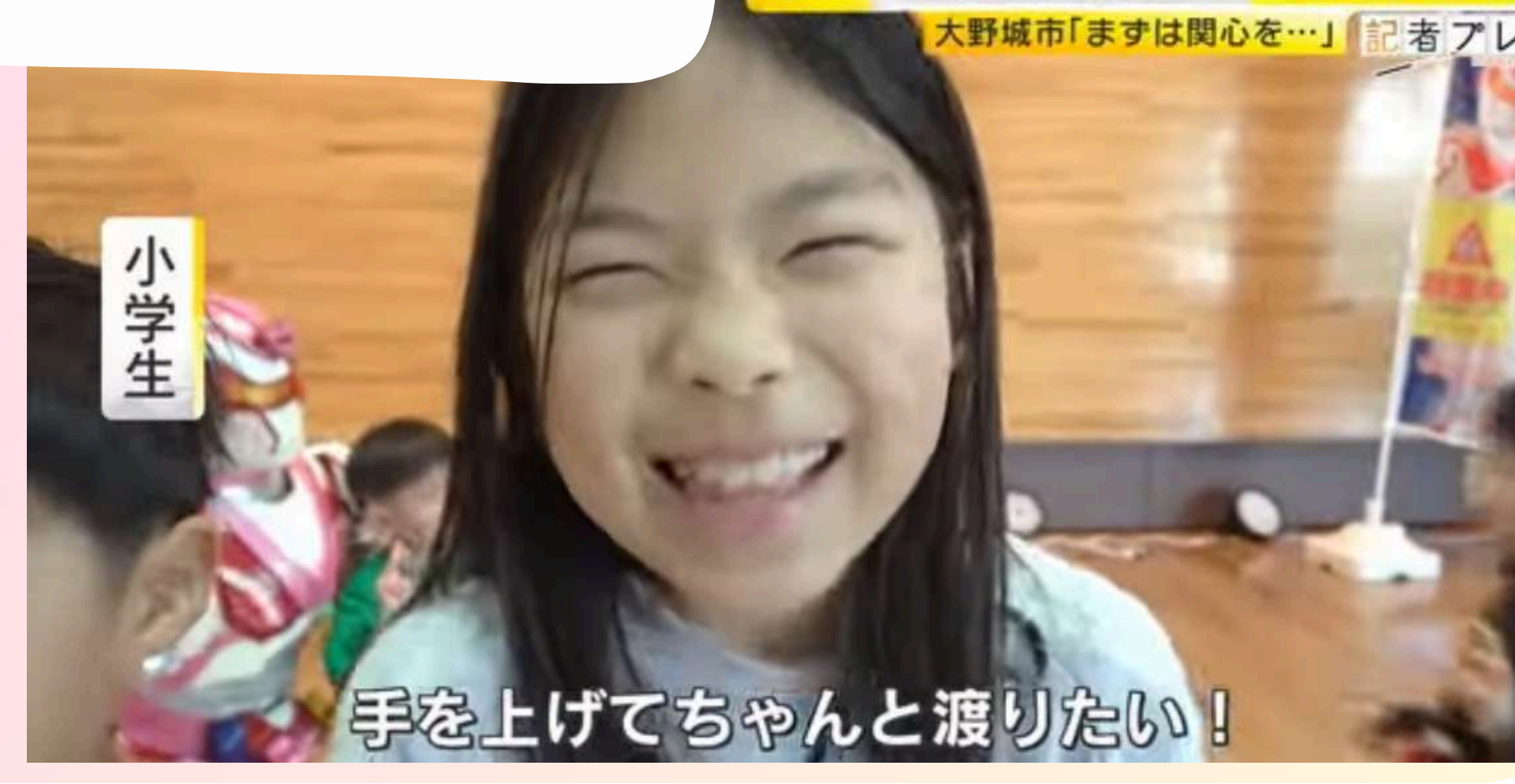
なぜ 命守る戦隊ヒロイン 2児の母が変身 大野城市「まずは関心を…」 記者アレ