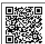
← ログイン方法 解説動画

● 問い合わせ先 コミュニティ文化課芸術文化担当 ☎ (580)1996 (公共施設予約システムに関する問い合わせ先)