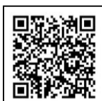
← 市の ホームページ