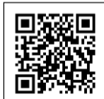
← 公共施設 予約システム