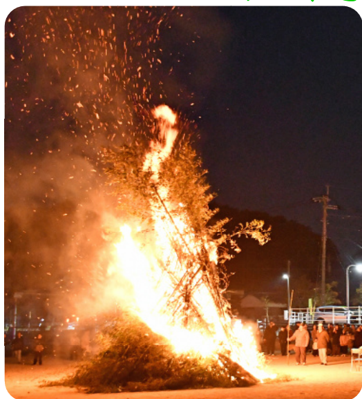
牛頸区「ほんげんぎょう」