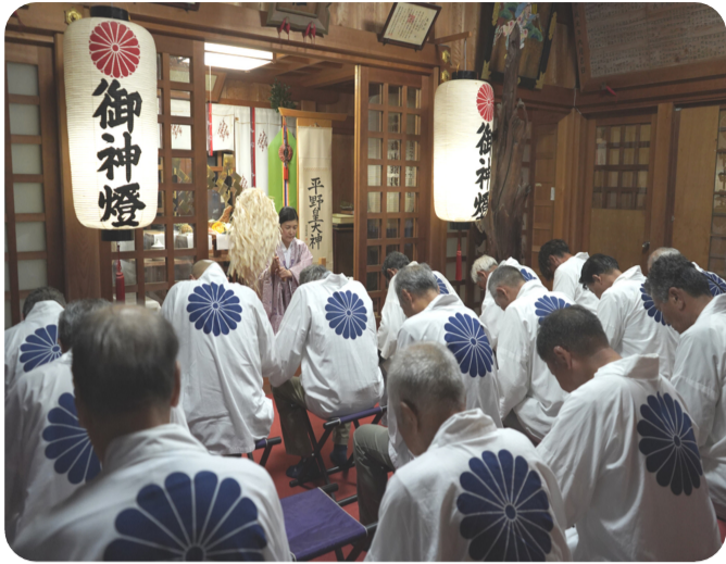
平野神社およど 7月18日(金)

南地区の各区で夏祭りが開催されました。多くの人が出で賑わい をみせ、連日の暑さに負けないぐらいの祭りの熱気が見られました。 （南ヶ丘2区は公民館改修のため未実施）