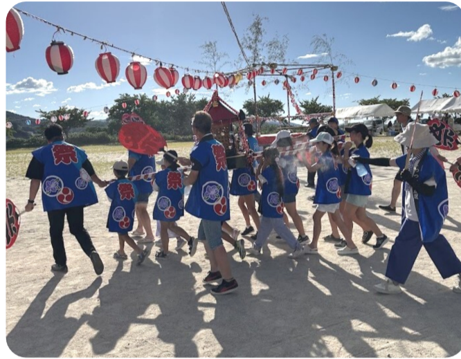
つつじヶ丘区 7月26日(土)