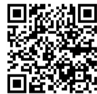
『天狗の鞍掛けの松』の QRコード